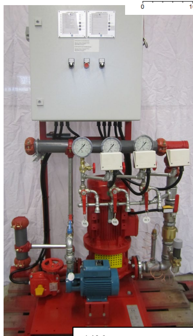
1406 För anslutning mot tank