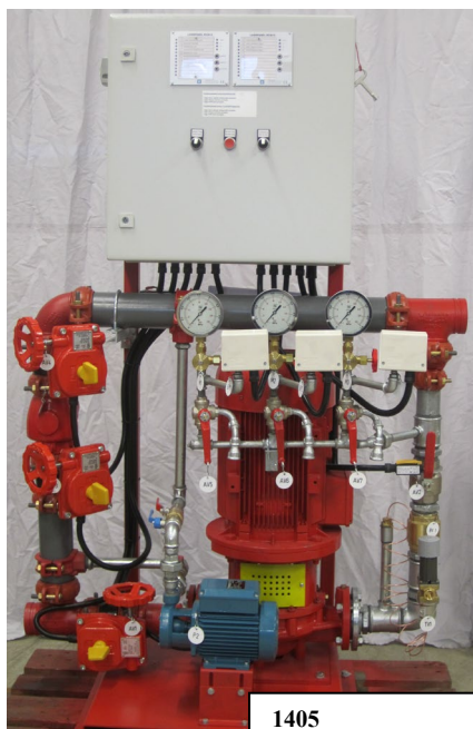
1405 För anslutning mot kommunal ledning